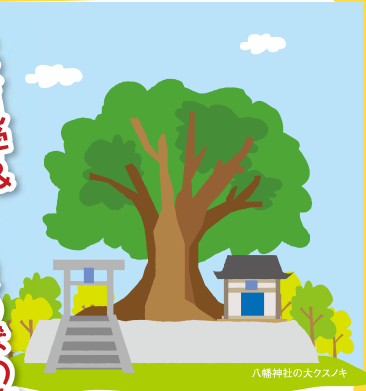
八幡神社の大クス