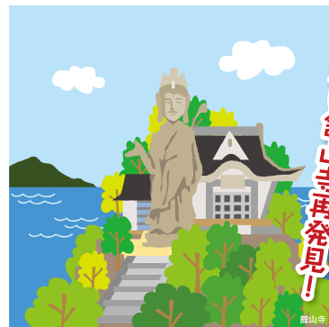
(発着場所) 館山寺観光協会